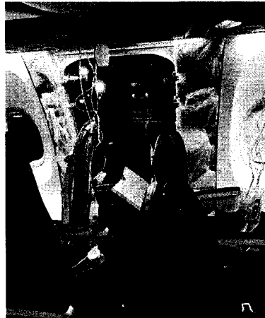
O uso da aeronave foi suspenso após um incidente em voo da Alaska Airlines nos EUA

O veto imediato ao modelo foi decretado por autoridades dos Estados Unidos e também se aplica ao Brasil, disse a Anac. Inicialmente, a agência afirmou que o avião em questão não era usado no país, mas depois disse ter identificado que ele era sim utilizado em voos internacionais no aeroporto de Guarulhos (SP) pela Copa Airlines. Ainda segundo a Anac, a empresa é a única companhia aérea que utiliza no Brasil o modelo. O uso da aeronave foi suspenso após um incidente em voo da Alaska Airlines nos EUA. Um painel do avião se abriu em pleno ar na sexta-feira (5), obrigando o piloto a fazer um pouso de emergência. Ninguém dos 171 passageiros e 6 tripulantes a bordo se feriu.