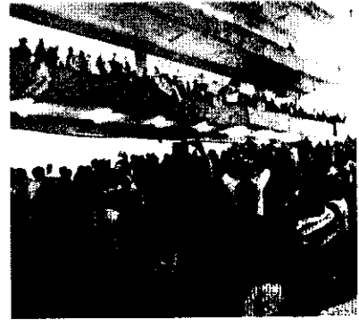
Apois ato na Secretaria da Educação, os professores foram recebidos pelo governador, que prometeu reajuste diferenciado para a categoria