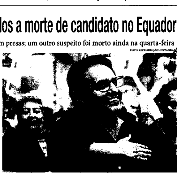
As eleições presidenciais do Equador estão mantidas e devem acontecer no próximo dia 20

ternacionalmente e o governo brasileiro se posicionou sobre o caso na quarta-feira. Em nota, o Ministério das Relações Exteriores afirmou que a situação é "deplorável" e manifestou a confiança de que os responsáveis pelo crime serão identificados e levados à justiça. O hamarary se disse ainda profundamente consternado com os fatos.