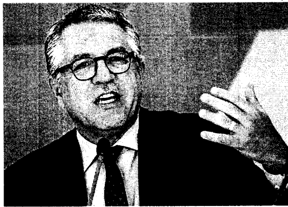
Padilha foi questionado mais de cinco vezes por jornalistas se a remuneração dos pastores estaria isenta

O ministro Alexandre Padilha evitou se comprometer sobre a remuneração dos pastores. Afirmou que a proposta vai tratar de algumas linhas mais genéricas, mas que um projeto de lei complementar vai estabelecer as regras mais específicas.