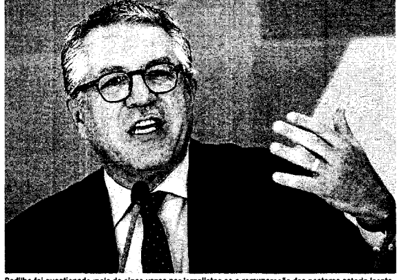
Padilha foi questionado mais de cinco vezes por jornalistas se a remuneração dos pastores estaria isenta