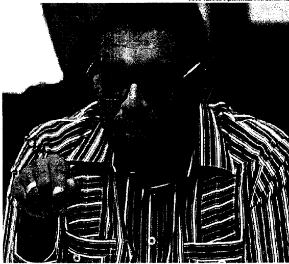
A área de Essequibo, alvo da disputa, corresponde a dois terços do território guianense

A lei possui 39 artigos que regulamentam a fundação da chamada “Guiana Essequiba”. Em seu artigo 25, a norma impede que apoiadores do governo da Guiana exerçam cargos públicos ou eletivos, o que protege a Venezuela de críticos do projeto. “Depois que o povo se manifestou constitucionalmente em 3 de dezembro, a Assembleia Nacional fez o que tinha que fazer, ampliou