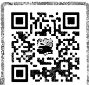
TABELA DE ENCARGOS SOCIAIS;